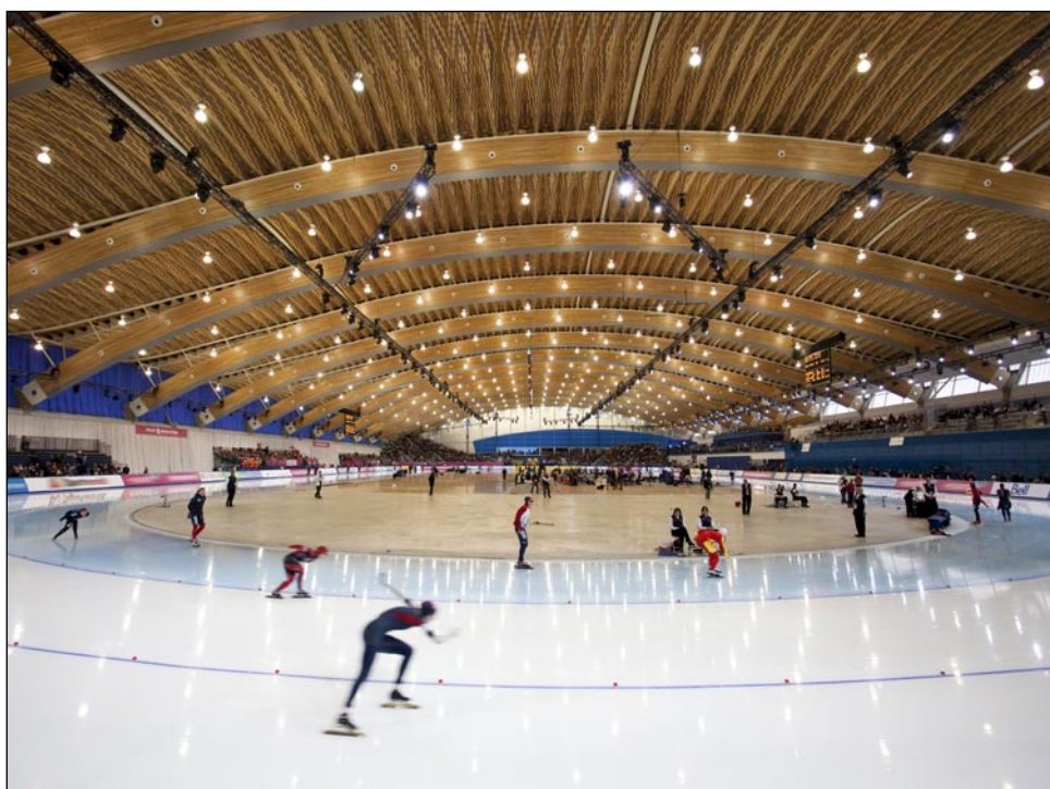
Vancouvers vinter-OL i 2010 bliver kritiseret for at være filtret sammen med lokale investorinteresser. På billedet ses Richmond Oval, der bliver centrum for de olympiske konkurrencer i hurtigløb på skøjter.